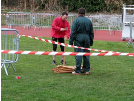
La construction du parc à vélo et