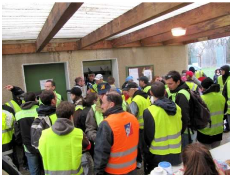
Quelques bénévoles sur les 140 présents