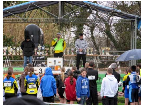
Briefing du directeur de course

D'autres photos bientôt en ligne sur le site du club