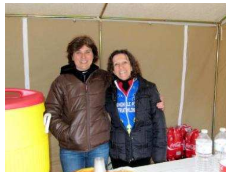
Le ravitaillement d'arrivée