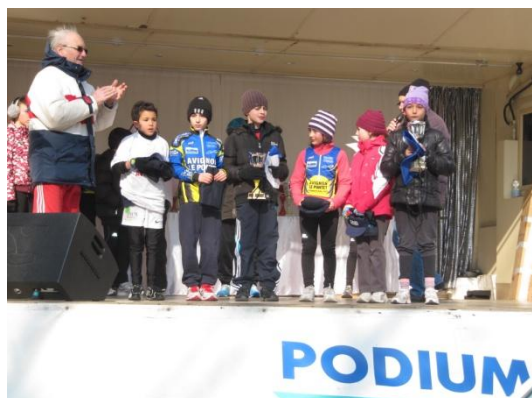
Podium Ecole Athlétisme